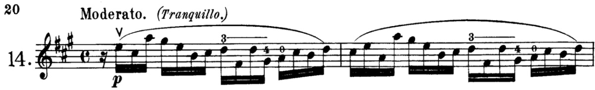
Şekil 1: Etüt 14. Legato ve yay kontrolü çalışması

Şekil 1 'de görülen La majör tonunda, Moderato tempoda yazılmış olan 14 numaralı etüt, yay kontrolü ve tuşe hassasiyeti elde etmeye yönelik bir çalışma olarak değerlendirilebilir. Bu eser, 4. parmağın esnetilmesine yönelik özel bir egzersiz niteliğindedir. Eserin içindeki tonal değişimlerin detaylı bir analizi yapıldığında, çalışma süreci büyük ölçüde daha kolay ve başarılı hale gelecektir. Ayrıca, bu tür bir analiz, olası entonasyon sorunlarını da ortadan kaldıracaktır. Kısacası, icracının kapris içindeki armoni ve akorlar hakkında kapsamlı bir bilgiye sahip olması büyük önem taşımaktadır. Ayrıca legato tekniği üzerine de odaklanan etüt, bir yay içinde birden fazla notanın pürüzsüz bir şekilde çalınmasını amaçlar. Legato, müzikal ifadede akıcı ve doğal bir geçiş sağlamak için gereklidir; bu sayede notalar arasında kesintisiz bir bağlantı kurulabilir. Dolayısıyla, sol elin doğru pozisyonları ve parmakların esnekliği, müzikal ifadenin derinliğini ve akıcılığını artırarak, performansın genel kalitesini yükseltir.