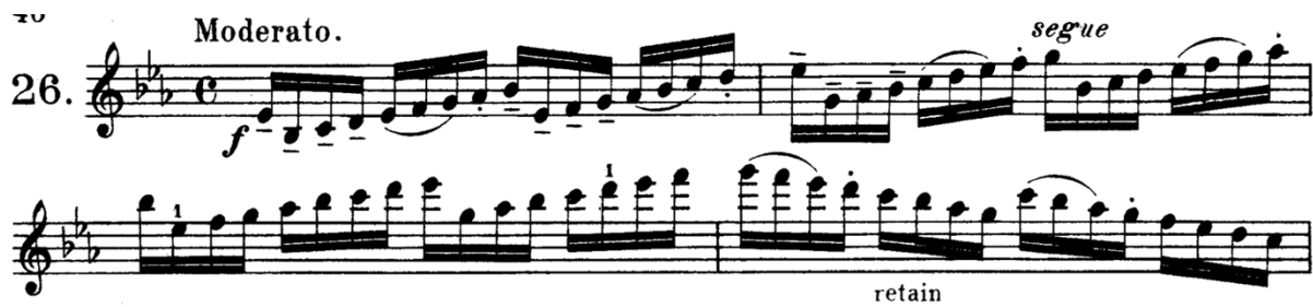
Şekil 5: Etüt 26. Kırık oktav ve pozisyon geçişi çalışması

Kreutzer'ın etütleri, sol elin pozisyon değişimlerini ve esneklik kapasitesini artırmaya yönelik kapsamlı çalışmalara yer verir. 23-26 numaralı etütler, oktav, kırık oktav ve pozisyon geçişleri üzerinde yoğunlaşır. Bu etütlerde öğrenciler, hızla ve doğru şekilde pozisyon değiştirebilme yeteneği kazandırılmakla birlikte, sol elin uygun şekilde yerleşmesi, doğru ve net bir entonasyon için zorunlu bir gereklilik olarak öne çıkar. Kreutzer, her bir etüt aracılığıyla, öğrencilerin sol eldeki hız, koordinasyon ve doğruluğunu geliştirmeyi hedefler. Bu etütlerin, özellikle pozisyon geçişlerine odaklanan bölümlerinin, kemancılara sağlıklı bir sol el tekniği kazandırmayı amaçladığı ifade edilebilir (Büyükgönenc, 2015, s. 29).