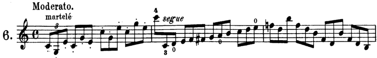
Şekil 3: Etüt 6. Martele tekniği çalışması

hızını artırır. Bunun yanı sıra etüt boyunca net ve temiz bir entonasyonun (notaların tam ve doğru yere basılarak temiz çalınması) olması çok önemlidir. Bunun için etüt çok yavaş bir şekilde ve sesleri çok iyi dinleyerek çalışılmalıdır. Etüt, farklı ritmik yapılar içerdiğinden, öğrencilerin ritim duygusunu geliştirmelerine de yardımcı olmaktadır.