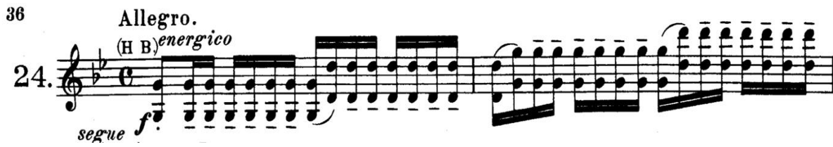
Şekil 6: Etüt 24. Oktav çalışması

Şekil 6'da görülen 24. etüt, kemançılara hem hız hem de doğruluk açısından çift seslerin çalınmasında beceri kazandırmayı amaçlar. Oktav geçişleri sırasında sesin temizliği ve entonasyonun doğruluğu büyük önem taşır.